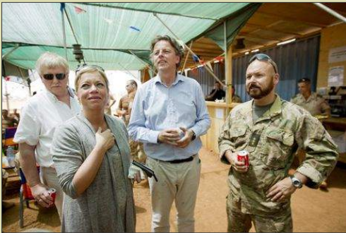
Tijdens zijn uitzending in Mali in gesprek met ministers Hennis en Koenders