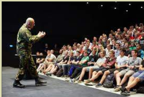
Ook een veelgevraagd spreker voor jeugdbijeenkomsten