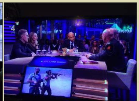
Een TV interview bij RTL Late Night van Humberto Tan