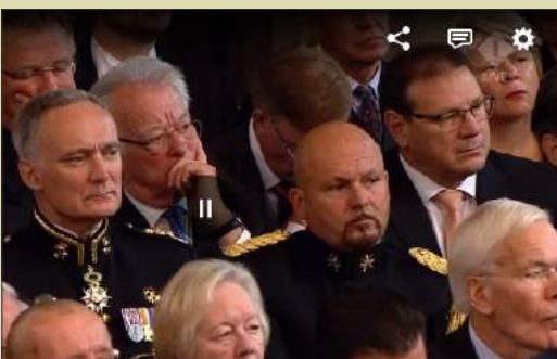
Luisterend naar de Troonrede op Prinsjesdag