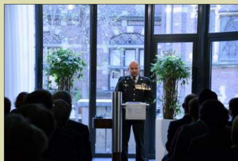
Uitgenodigd voor houden van herdenkingsrede op 4 mei bij Perscentrum Nieuwspoor