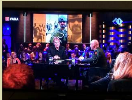
Een TV interview bij Pauw