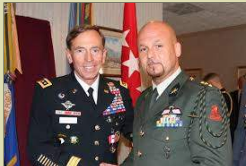
Een vriendschappelijke ontmoeting met de Amerikaanse 4**** generaal Petraeus