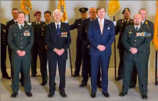
Met drie van de vier Ridders Militaire Willems-Orde bij Koning Willem-Alexander