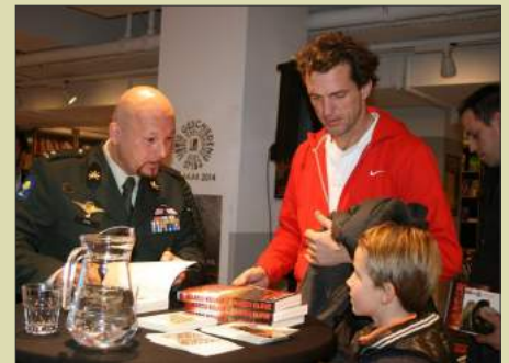
Tijdens één van zijn vele signeersessies