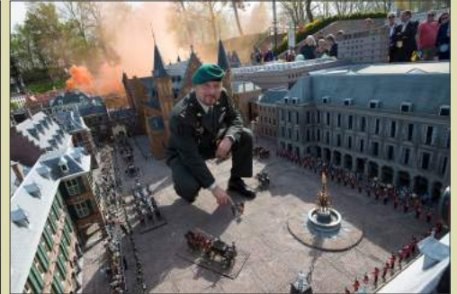
Plaatsing van een miniatuurversie van zichzelf op het Binnenhof van Madurodam