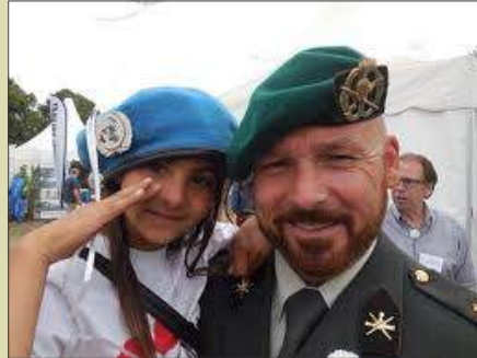
Tijdens de landelijke Veteranendag in Den Haag